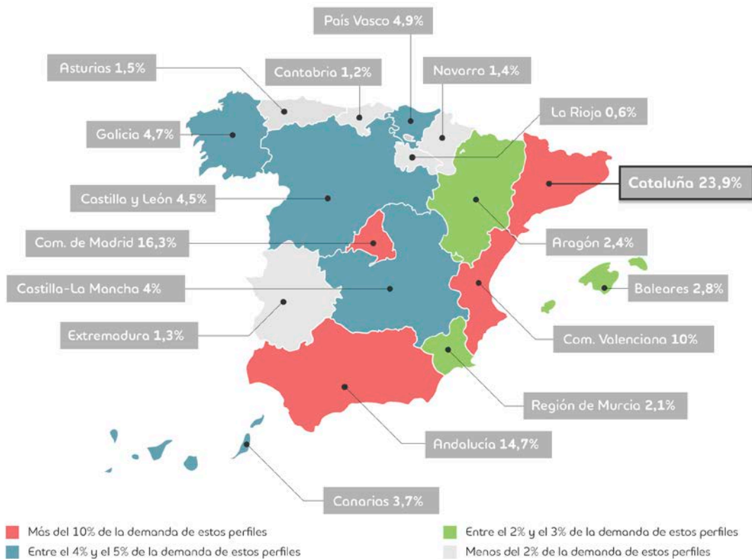
Distribución de la demanda de dependientes especializados por regiones

En función de la zona de residencia de los profesionales, estos encontrarán mayores o menores dificultades a la hora de buscar empleo. Cataluña lidera la demanda de estos perfiles y aglutina el 23,9% de las ofertas de empleo destinadas a dependientes especializados, por lo que una persona en Cataluña tendrá más oportunidades de encontrar empleo como dependiente que en otra región de la geografía española.