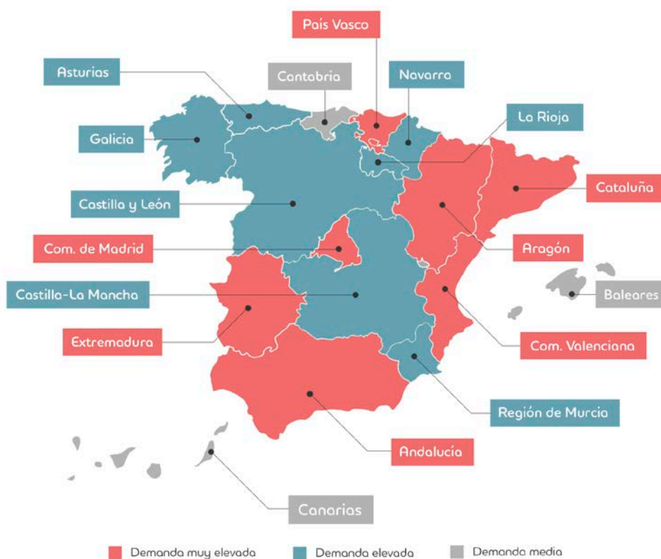
Distribución de la demanda de técnicos de mantenimiento por regiones

Los requisitos que debe cumplir este perfil son los siguientes: